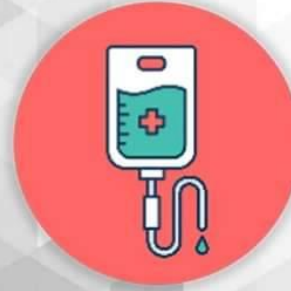
การให้ยาเคมีบำบัด