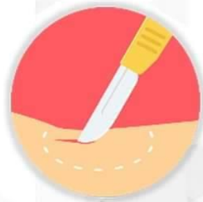
การผ่าตัด