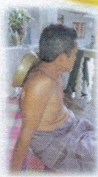
ผู้ป่วยที่มารับการรักษา