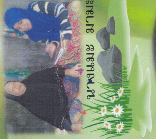
นางแม่ มามะ